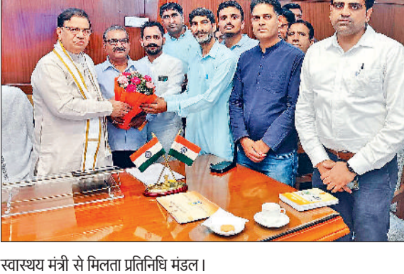
स्वास्थ्य मंत्री से मिलता प्रतिनिधि मंडल।