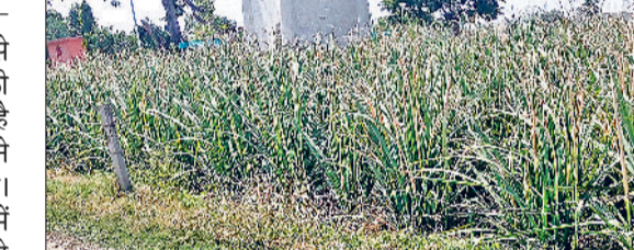
यमुनानगर में खेतों में गर्मी की तपिश में झुलसी हुई गन्ने की फसल की पतियां।

बारिश नहीं होने और महीना भर से आसमान से टपक रही आग में गन्ने की फसल झुलसने लगी है। आलम यह है कि गन्ना की फसल की पतियां सूखने लगी हैं और फसल की ग्रोथ रुक गई है। किसानों के मुताबिक गन्ने की फसल में